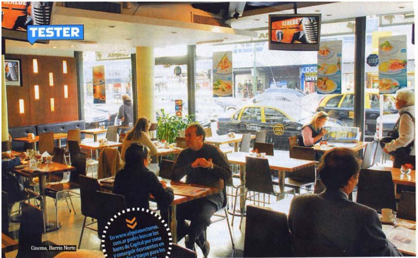
Cinema, Barrio Norte

En www.elguianocturno.com.ar podés buscar los bares de Capital por zona y conseguir descuentos en entradas y trajes para los fines de semana.