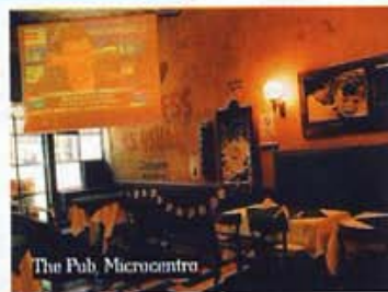
The Pub, Microcentro